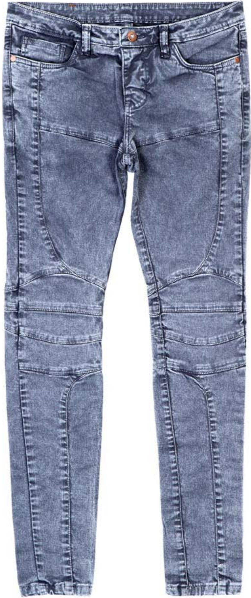
TECIDO JAZZ WASHED BY PIZARRO