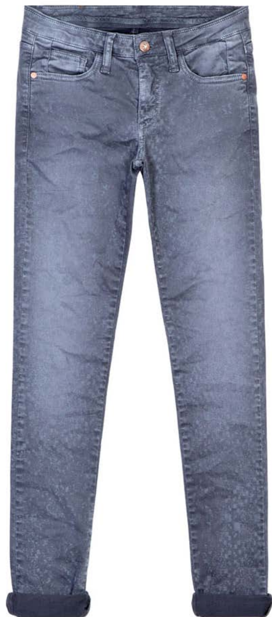
TECIDO MUNICH WASHED BY PIZARRO Tingimento Rongeável + Laser.