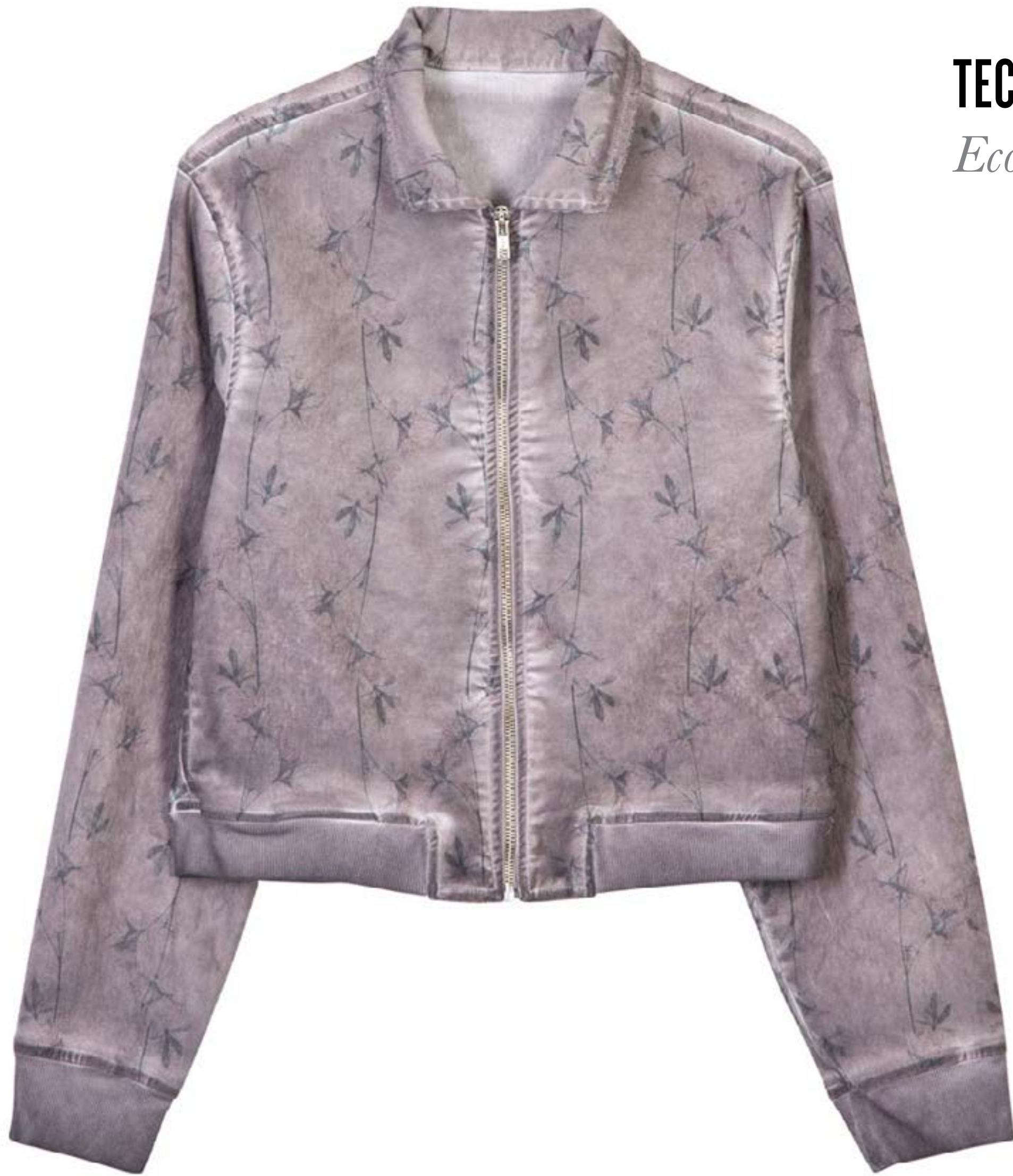
TECIDO LICKE WASHED BY HI-TECH Eco-Tingimento.