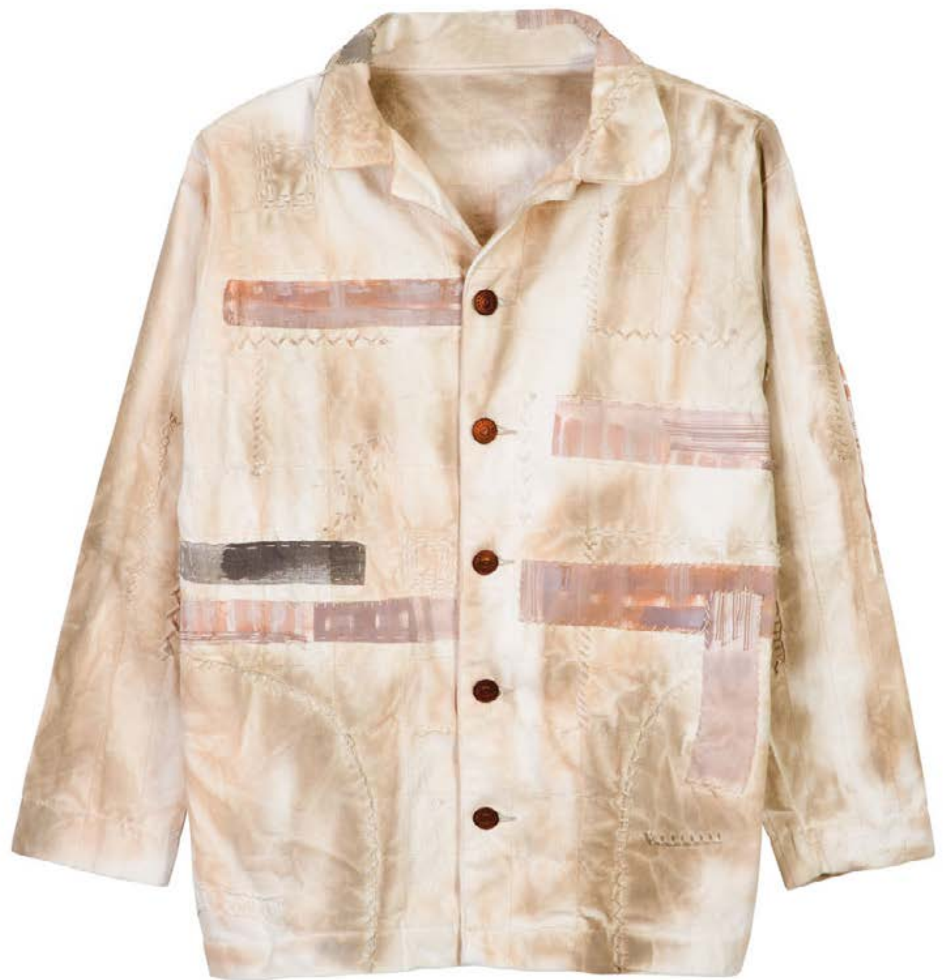
TECIDO WHITE JEANS WASHED BY ZIL COSSI