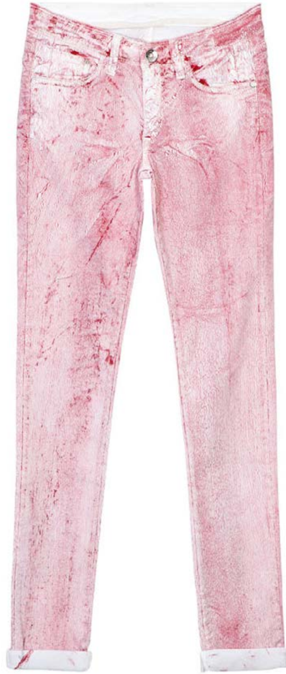
TECIDO MUNICH WASHED BY MAQLAV Efeito Spider com pigmento