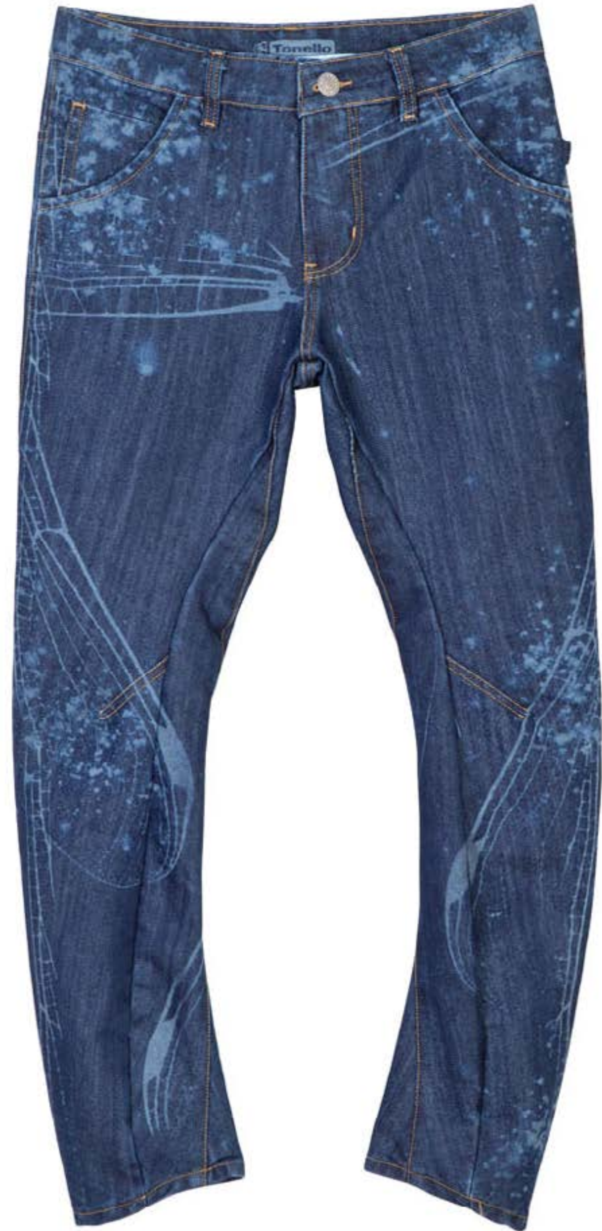
TECIDO MORETTI WASHED BY TONELLO