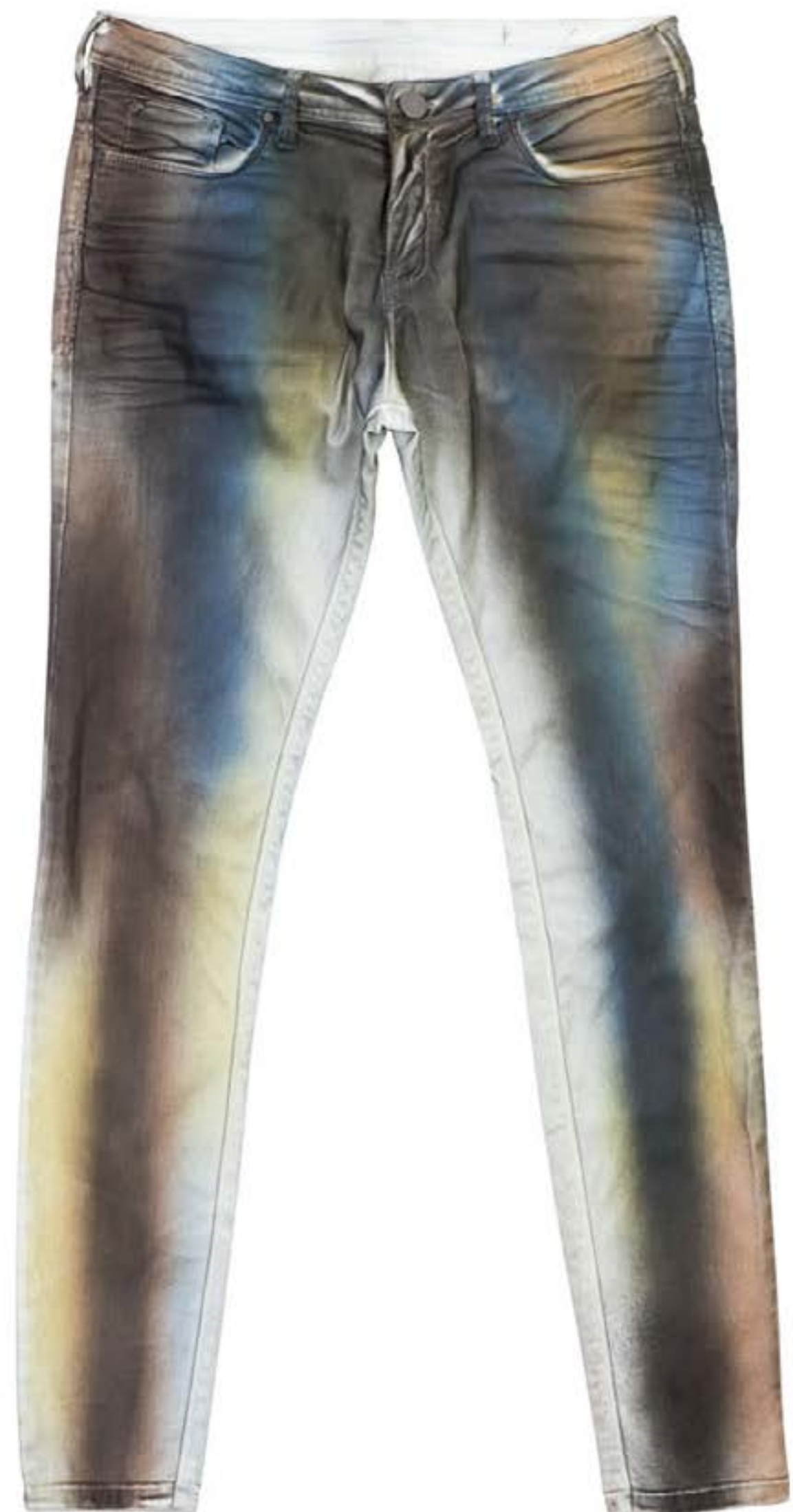
TECIDO MUNICH WASHED BY EMPHASIS Jato Colors