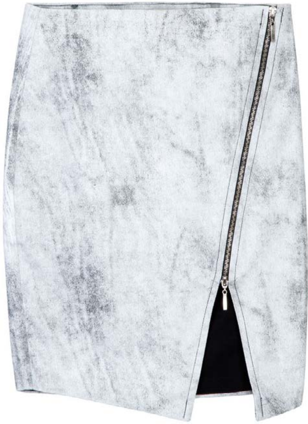
TECIDO CHER WHITE WASHED BY PALAGI