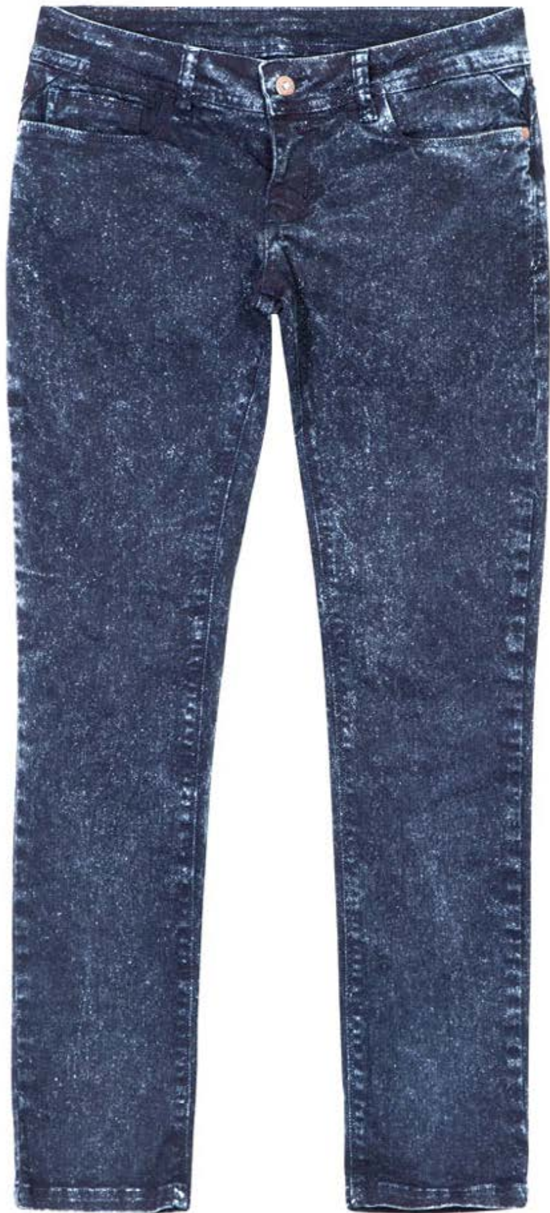
TECIDO COLOR JEANS ST. WASHED BY PIZARRO. Tingimento + Starry Sky.