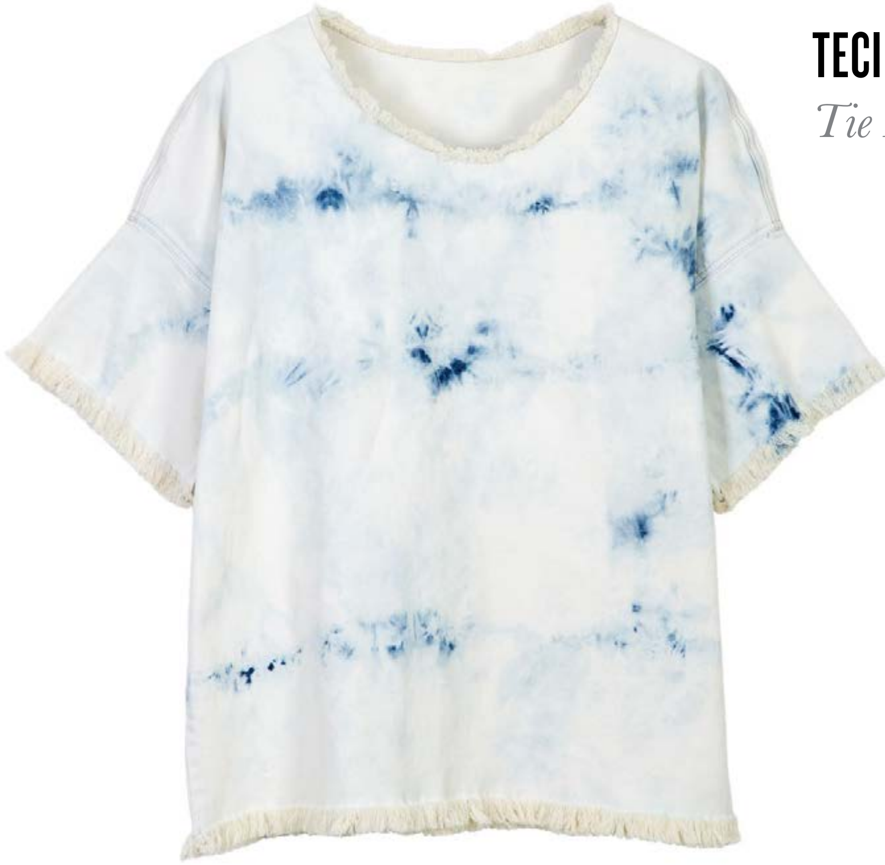
TECIDO MISSOURI WASHED BY EMPHASIS