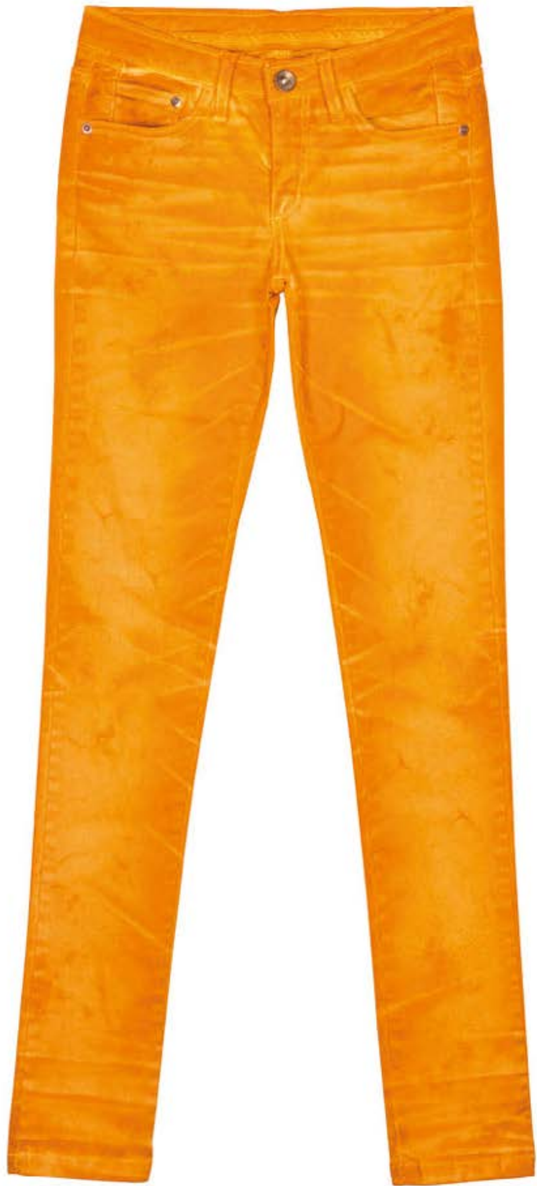
TECIDO MUNICH WASHED BY ATLAS

Cationização + Tingimento + Laser + Stone.