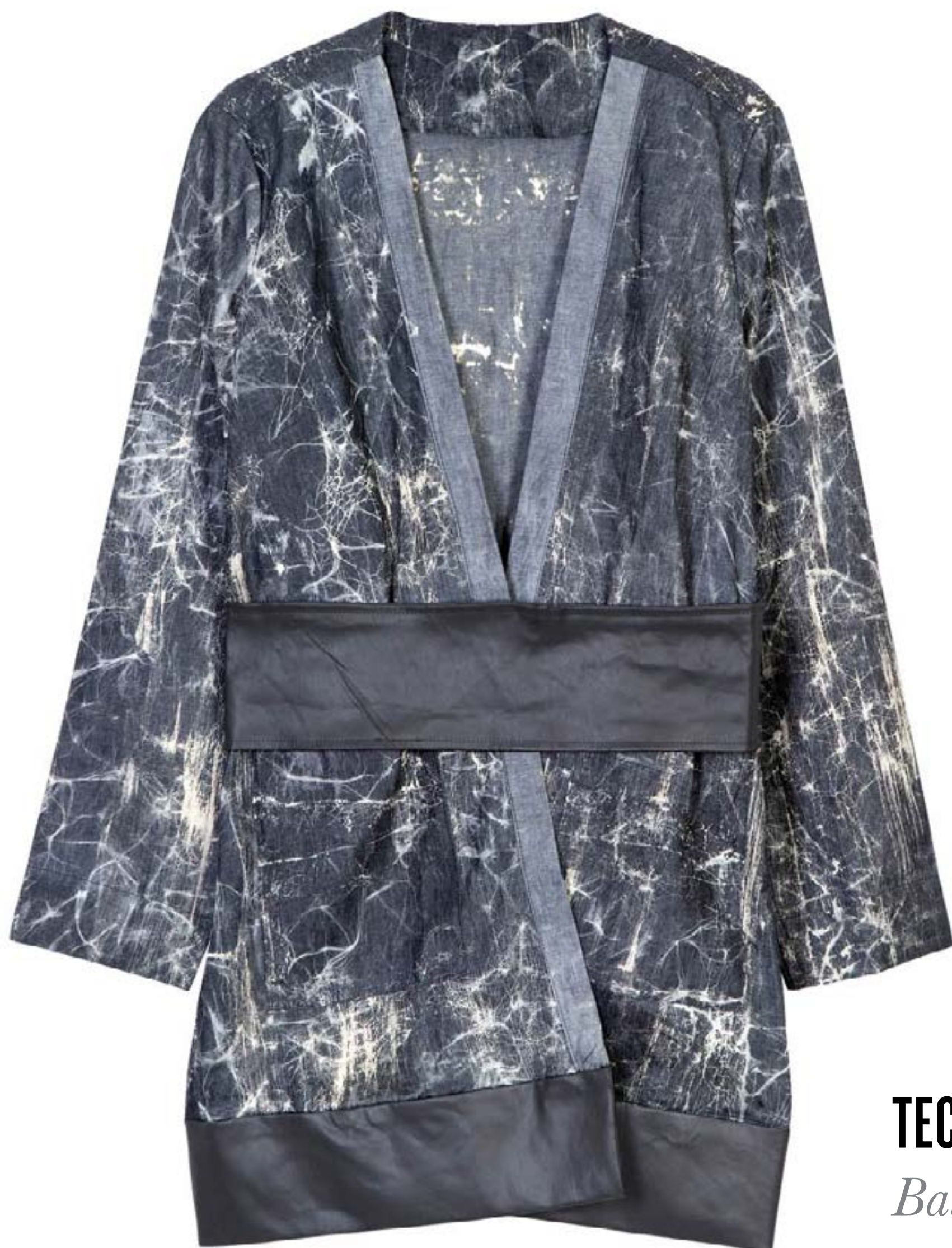
TECIDO COLIN BLACK WASHED BY HELENA RATTO Batik